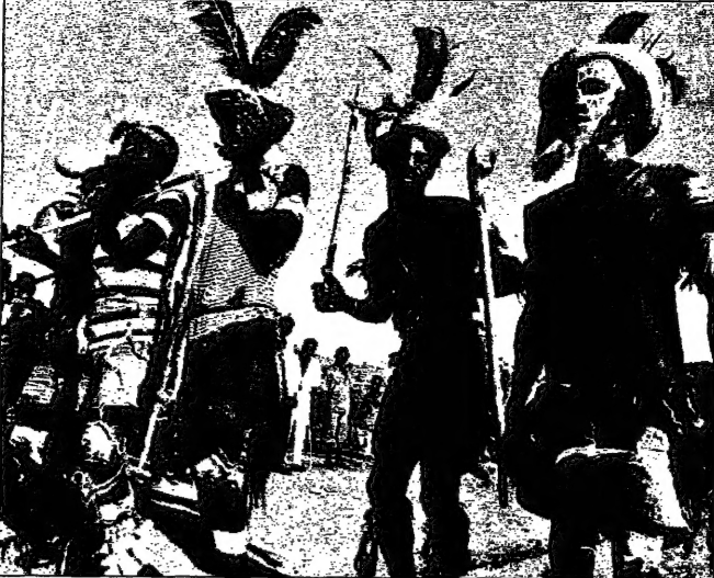
خوخيته - سودانيون يخدمون في الجيش الليبي (15 عاماً على بدء حركة التحرير) (ديفانت)

تحقق المصالحة الوطنية لليبيا مساعيها الرامية الى تسوية الوضع الداخلي الليبي... من خلال حفل خيخيته... الخروطوم - والدقن العربي